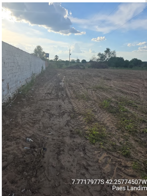
Rua Projetada 02