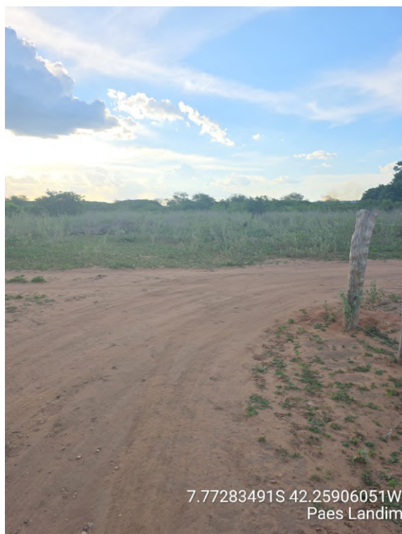
Rua Projetada 03