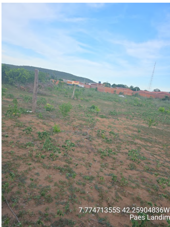
Rua Projetada 06